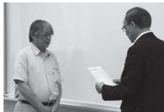
▲健康でいきいきと暮らせる村を目指します

村は、5月から7月まで計5回の脳若トレーニングボランティアアスタツ研修会を行いました。会では受講者が、タブレット端末を使った認知症予防プログラム「みつおか式脳若トレーニング」を体験し、楽しく講座を進めるコツなどを学びました。受講した皆さんは今後、村が8月から全15回開催を予定している「認知症予防講座」のサブインストラクターとして活動を行います。