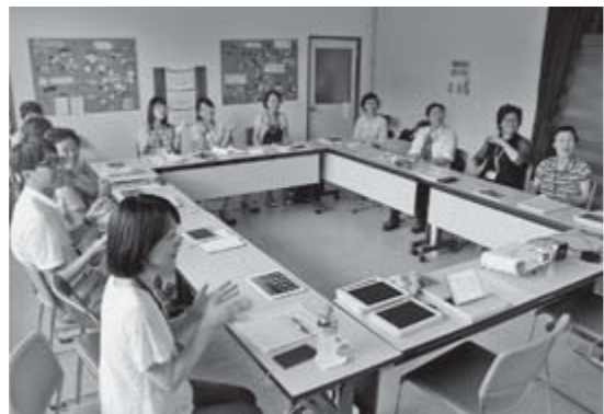
▲楽しく、笑いながら脳をトレーニングします

初回は 8月11日(火) 13:30~15:00 旧松川小仮設住宅談話室 で行います。