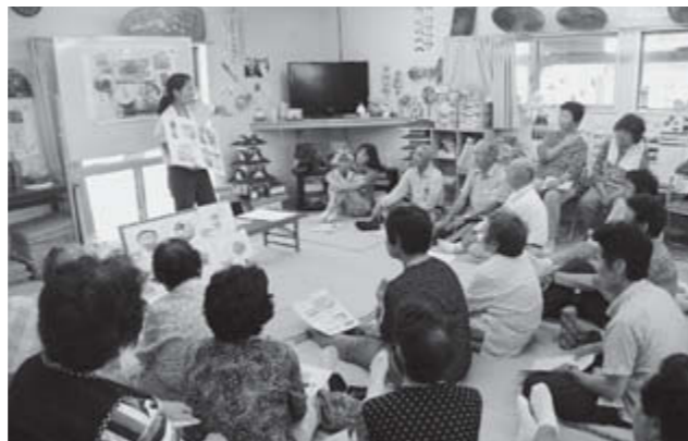
▲村管理栄養士と正しい減塩方法について学びました