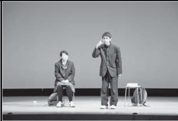
県大会での上演(田村市文化センター：右写真も同じ)