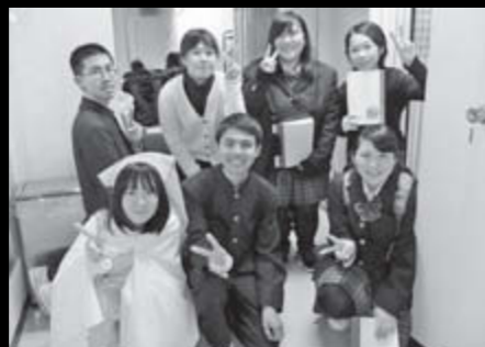
今を大切に生きているということ 演劇だから伝わるんだと思う

11月25日から3日間にわたって開かれた第69回「福島県高校演劇コンクール」において、優秀賞第1席を獲得した飯館校演劇部。上演したのは、サテライト校の仮設校舎を舞台に、現在の学校生活を大切に思う生徒たちと、生徒の姿を求めてさまよう村内校舎の「ファントム(※幻影・亡霊などの意味)」との切ない出会いを描いた「ファントム オブ サテライト」飯館校の怪人」です。