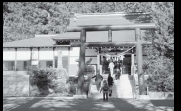
再建された山津見神社では例大祭が行われました